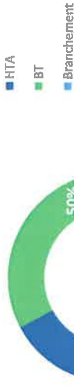
Types d'ouvrage endommagé