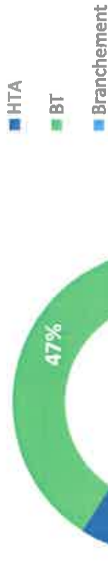
Types d'ouvrage endommagé